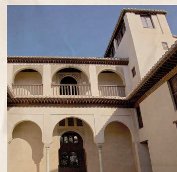
Palacio de Dar al-Horra