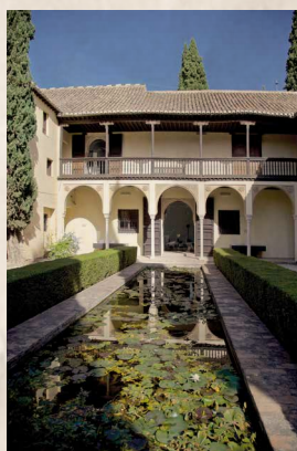
Casa del Chapiz