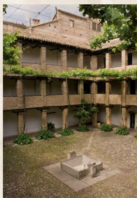
Corral de Carbón