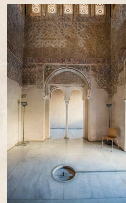
Alcázar del Genil