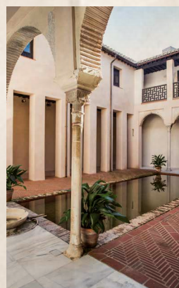
Casa de Zafra