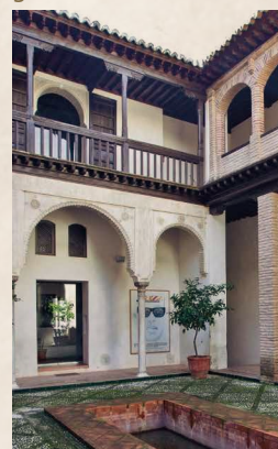
Casa Horno de Oro